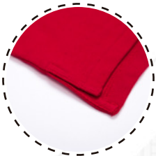
TERMINACIÓN TAJALÍ A LOS COSTADOS