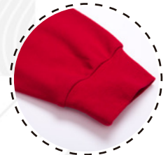
BOCAMANGA EN RIB 1X1