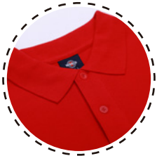
CUELLO CAMISERO DE DOS BOTONES