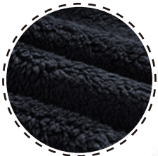
INTERIOR CON CORAL FLEECE