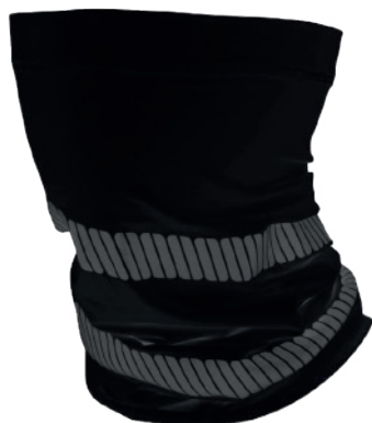
BANDANA KUMEN ALTA VISIBILIDAD