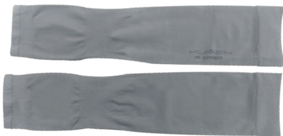
MANGUILLA KUMEN COOL MAX