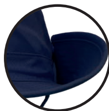
BROCHES DE VISERA