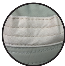
BANDA DE SUDOR