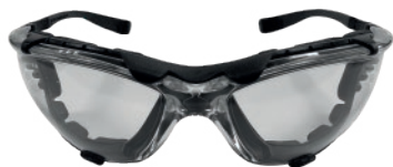
LENTE RESISTOR LIDO ULTRA

Complementa tu outfit con Lentes Resistor Lido ultra, Bandana Kumen alta visibilidad y Manguilla Kumen cool max.