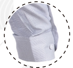
PUÑO DOBLE BOTÓN

T-WORLD , es ropa corporativa de alta calidad, diseñada con estilo único, acompañando a los trabajadores y empresas de todo Chile.