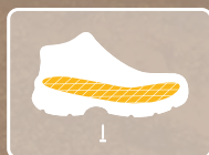
PLANTILLA TEXTIL ANTIPERFORANTE