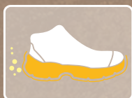
RESISTENTE A LOS Y SUS DERIVADOS HIDROCARBUROS