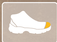
PUNTERA DE COMPOSITE