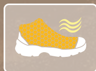
EVACUACIÓN DE LA HUMEDAD