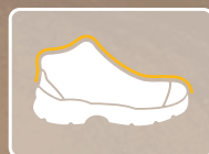
RESISTENTE A IMPACTOS