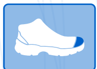
PUNTERA DE ACERO