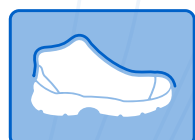
RESISTENTE A IMPACTOS