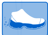
RESISTENTE A LOS Y SUS DERIVADOS HIDROCARBUROS